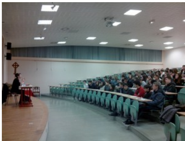
A l'Amphi avec les 2nde Générales